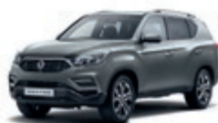
Elemental Grey (ACY)*