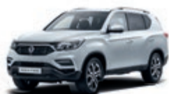
Fine Silver (SAF)*