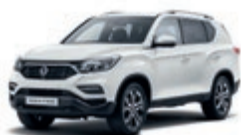
Grand White (WAA)