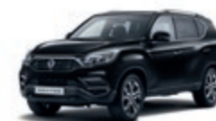
Space Black (LAK)*