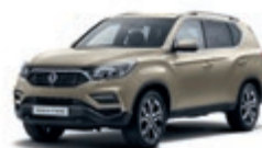
Sabia Beige (EBE)*