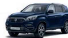
Atlantic Blue (BAU)*