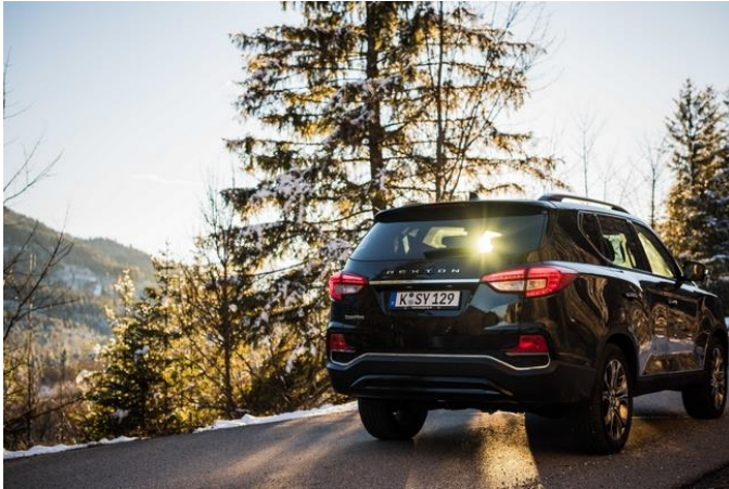
© SsangYong Motors Deutschland Das SsangYong Flaggschiff ist mit seiner Anhängelast von 3,5 Tonnen universell einsetzbar und auf jedem Terrain stets sicher unterwegs.