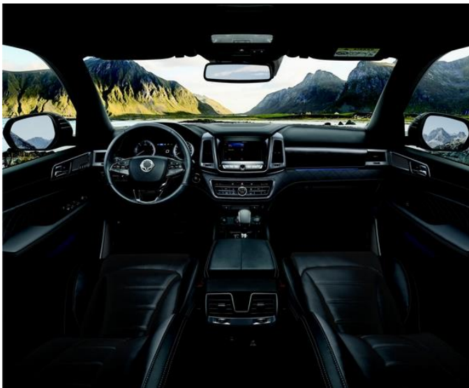
Neu im Rexton Modelljahr 2019 sind dunklere, metallische Einfassungen am Armaturenbrett, auch den Wählhebel der 7-Stufen-Automatik ziert nun ein metallisches Dekor.