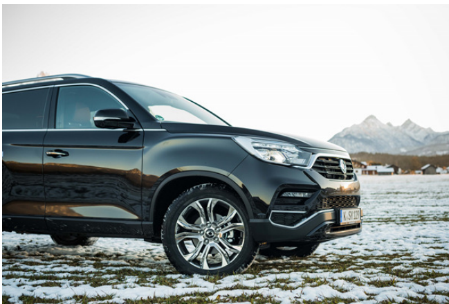
Außen besticht der SsangYong Rexton durch eine sportliche Optik. Im Inneren können sich Fahrer und Fahrgäste auf die gewohnt zahlreichen Komfort- und Sicherheitsmerkmale bereits ab der Einstiegsvariante freuen.