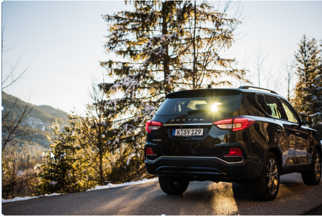
Mit einem Radstand von 2,87 Metern bietet der SsangYong Rexton in der neusten Modellgeneration noch mehr Platz für alle Fahrgäste.